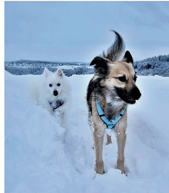
Hunde brauchen Auslauf, auch wenn's kalt ist.

Der Hund braucht auch Beschäftigungen neben der Erziehung. Dafür eignen sich ausgiebige Spaziergänge, auf denen der Hund sich austoben und spielen kann. Auch Sie brauchen nach einem strengen Arbeitstag Ihren Sport-, Jass- oder Was-auch-immer-Abend.