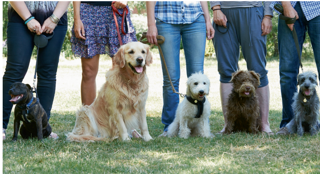
Die Hundeschule – ein Muss für Hund und Halter.

Ich nehme dieses Unterkapitel bewusst vorweg, weil für den unerfahrenen Hundebesitzer der Besuch einer Hundeschule nicht nur empfehlenswert, sondern unabdingbar sein sollte. In der Hundeschule werden der Hundehalter und sein Hund von erfahrenen Spezialisten ausgebildet, man lernt Gleich-