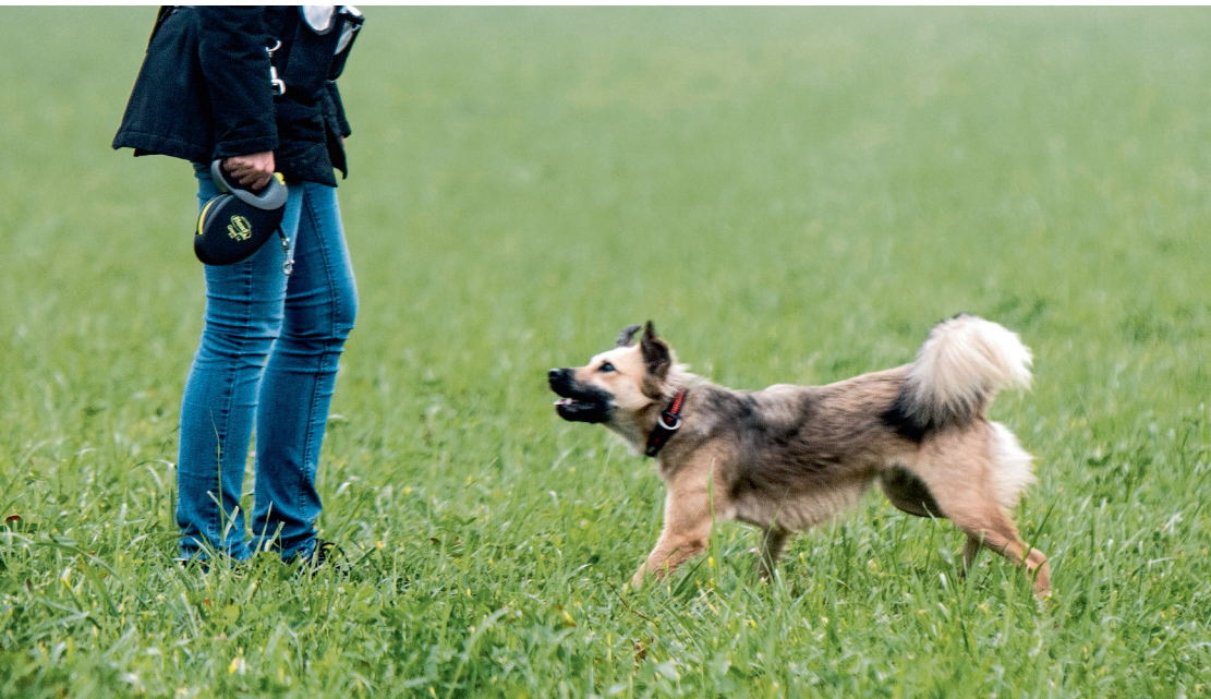
Habe ich es gut gemacht?

gesinnte kennen und macht erste Erfahrungen im Umgang mit anderen Hunden. Zudem hat sowohl der Vierbeiner als auch der Hundehalter durch das Lernen in der Gruppe mehr Spass an der Sache.