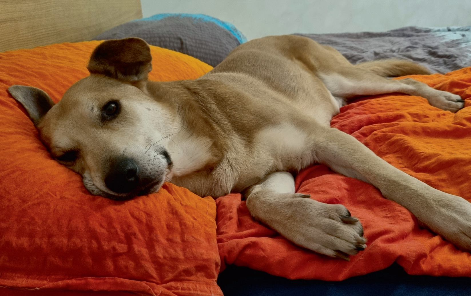
Entspannt auf dem Doppelbett – was darf der Hund in der Wohnung?